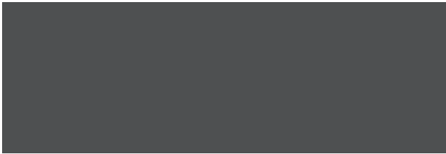
Anthracite Grey RR2H8/SS0087