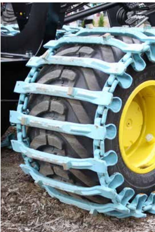
Es zeigt ECO-TRACKS, Modell EVO-Soft.