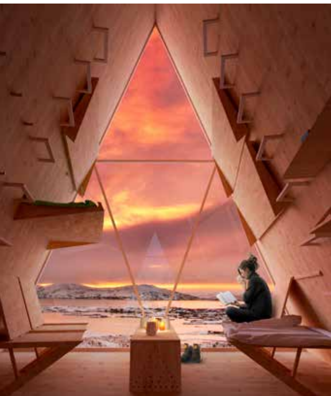
ФОТО ПРОЕКТА «SKÝLI»: АРХИТЕКТУРНОЕ БЮРО UTOPIA ARKITEKTER (СТОКГОЛЬМ)