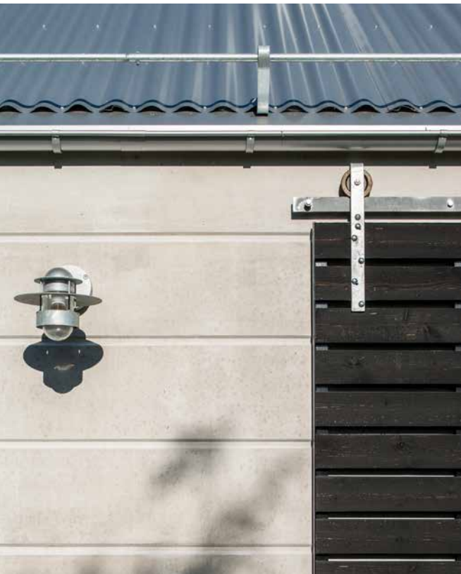
HOUSE KD:N