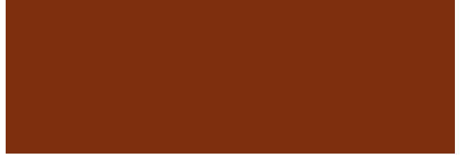
Tile Red RR750/SS0760