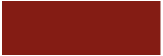
Cottage Red RR29/SS0758