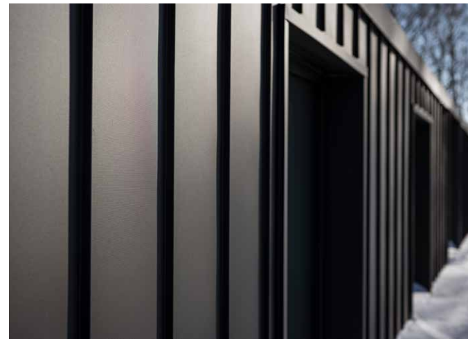
IMMAGINI HOUSE IN THE MOUNTAINS: MACIEJ LULKO, POLONIA. COPYRIGHT: SSAB