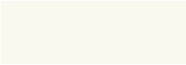
Snow White RR19/SS0001 (disponibile a richiesta)