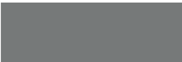
Metallic Dark Silver RR41/SS0044 (disponibile a magazzino)