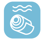
Laminato a caldo

Le applicazioni tipiche del SSAB Form sono pulegge, console, cilindri imbutiti, gabbie dei cuscinetti a sfera, cerchi, armadietti, strutture tubolari, cappe speciali e serrande decorative dalle forme speciali.