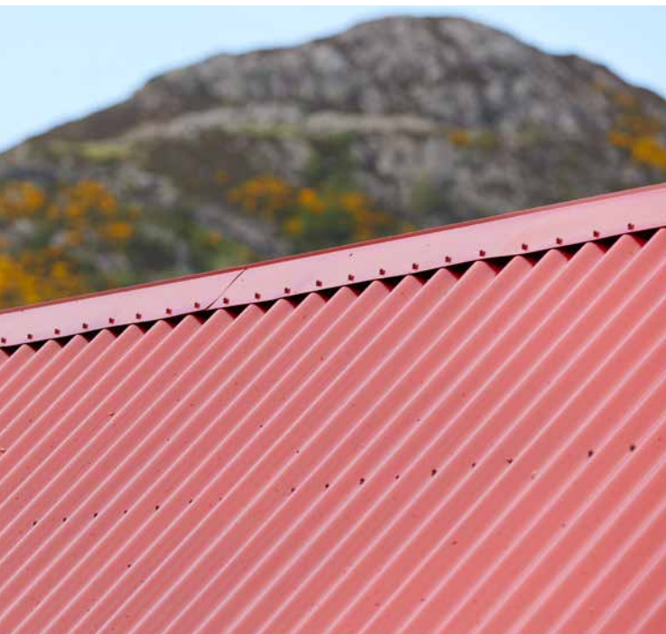
FOTO'S FERNAIG COTTAGE: AI REY SPACES, ARCHITECTUURFOTOGRAFIE; AUTEURSRECHT: SSAB

PROJECT: WESTER ROSS, SCHOTLAND, VK »FERNAIG COTTAGE«