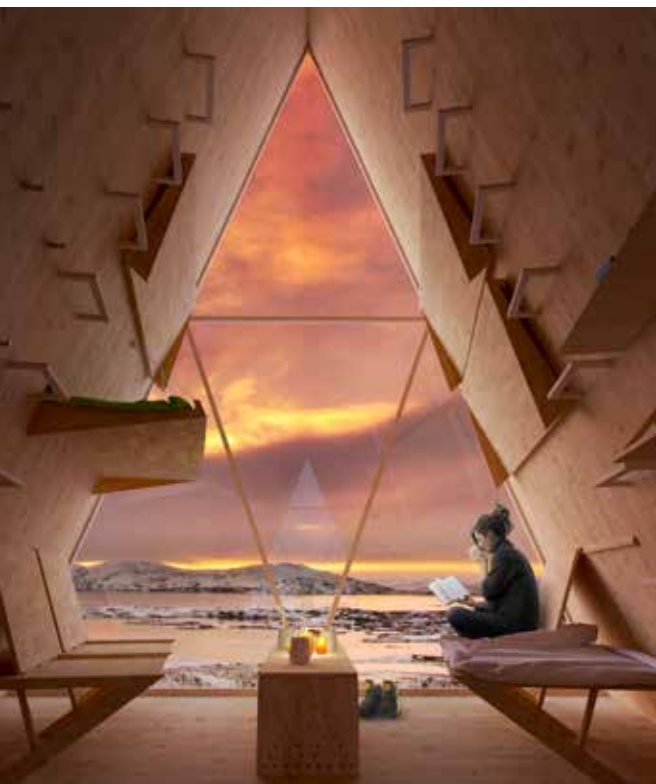
BILDER SKÝLI: UTOPIA ARKITEKTER, STOCKHOLM