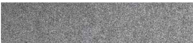
Metallic Dark Silver RR41/SS0044