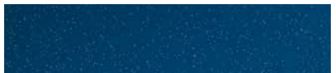
Lake Blue RR35/SS0558