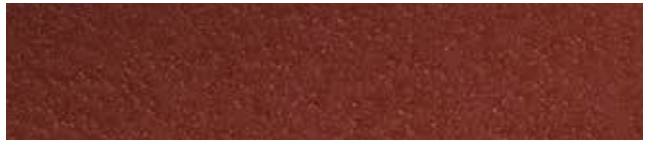
Cottage Red RR29/SS0758