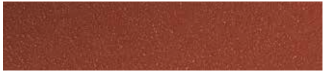
Brick Red RR7F2/SS0742