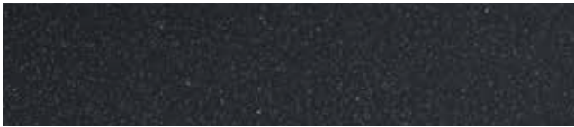
Mountain Grey RR23/SS0036