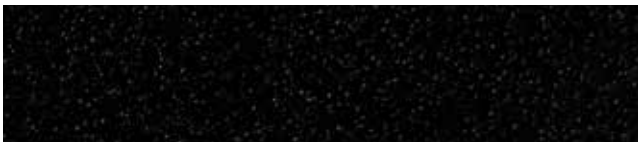
Nordic Night Black RR33/SS0015