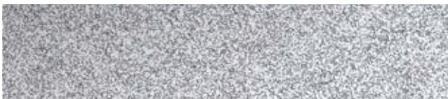
Metallic Silver RR40/SS0045