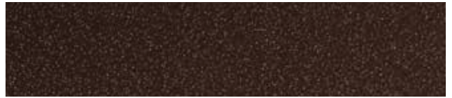
Coffee Brown RR820/SS0384