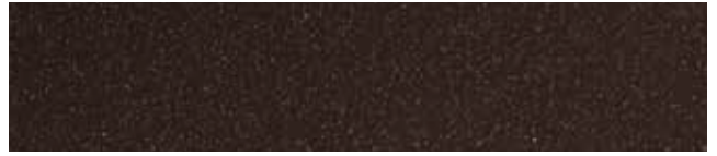
Acorn Brown RR827/SS0434