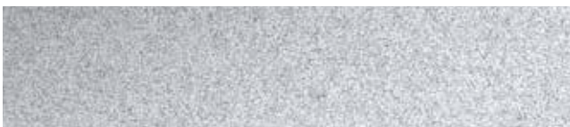
Metallic Sterling RR974/SS6045