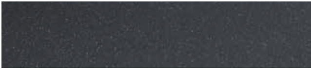
Anthracite Grey RR2H8/SS0087