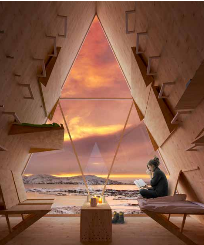
ZDJĘCIA SKÝLI: UTOPIA ARKITEKTER, SZTOKHOLM