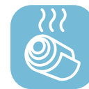
Taśmy walcowane na gorąco

Typowe zastosowania SSAB Form obejmują koła pasowe, wsporniki, koszyki łożysk kulkowych, obręcze, szafy, konstrukcje rurowe, pokrywy oraz dekoracyjne żaluzje o specjalnych kształtach.