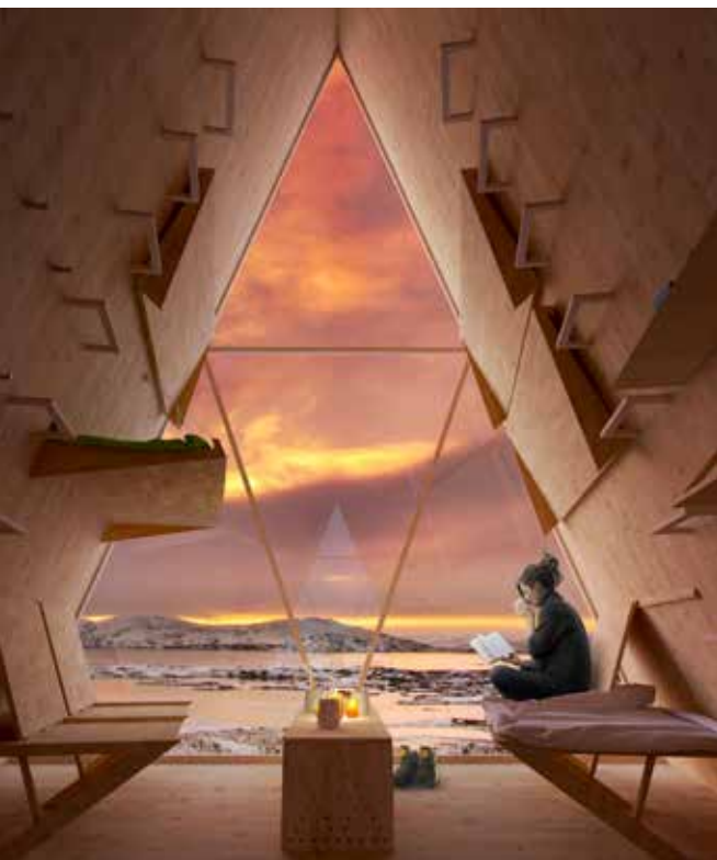
ФОТО ПРОЕКТА «SKÝLI»: АРХИТЕКТУРНОЕ БЮРО UTOPIA ARKITEKTER (СТОКГОЛЬМ)