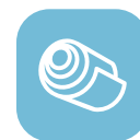
Холоднокатаная тонколистовая сталь