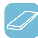
Горячекатаная толстолистовая сталь

Сталь SSAB Domex® обеспечивает стабильный, предсказуемый результат при любых видах механической и термической обработки. Для повышения эффективности работы вашего предприятия нет ничего проще, чем использовать материал, на который вы можете положиться.