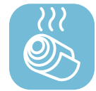
Горячекатаная тонколистовая сталь

Сталь SSAB Form используется для изготовления шкивов, консолей, цельнотянутых цилиндров, сепараторов шарикоподшипников, газовых баллонов, колесных дисков, специальных кожухов и декоративных заслонок особой формы.